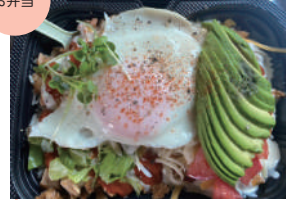
JP's vender 61