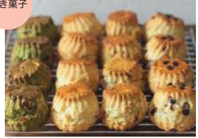
焼菓子ときまぐれ ときどき